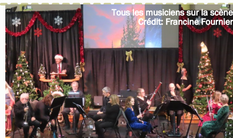
Tous les musiciens sur la scène

J'en profite pour remercier très sincèrement notre conseil municipal pour l'aide à la culture. La présence de nos élus intéressés aux activités culturelles