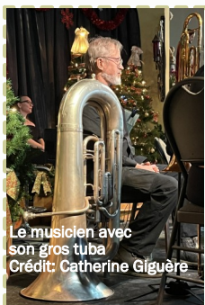
Le musicien avec son gros tuba